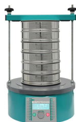
Анализатор А 20 на базе ВПС