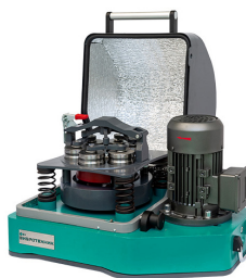
Истиратель вибрационный ИВ 6