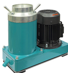
Дробилка конусная ВКМД 10