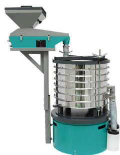
Грохот ГР 50 с Питателем ПГ 1

Качество оборудования компании «ВИБРОТЕХНИК» оценили свыше 15000 клиентов из 50 стран мира. Постоянными клиентами компании «ВИБРОТЕХНИК» являются лаборатории крупнейших металлургических предприятий: