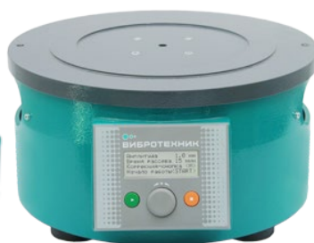
Рис. 2. Вибропривод ВПС