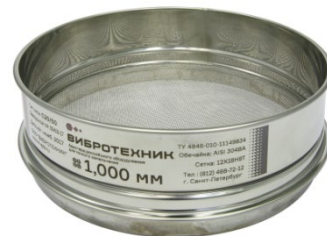
Рис. 3. Сито С20/50