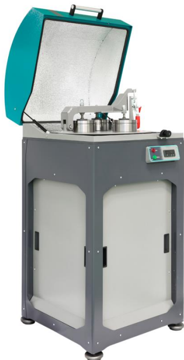
Рис. 1. Истиратель вибрационный ИВ 3М

1.3 Поставленная задача: Измельчение до крупности менее 50 мкм, требуемая производительность – 0,5 кг/час.