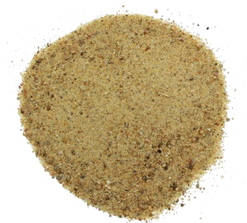
Рис. 3. Материал до измельчения