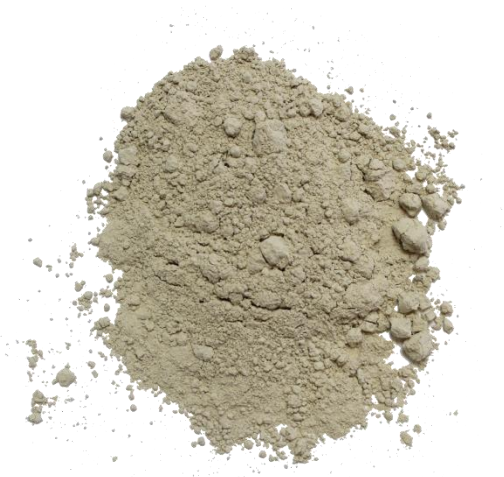
Рис. 4. Продукт измельчения