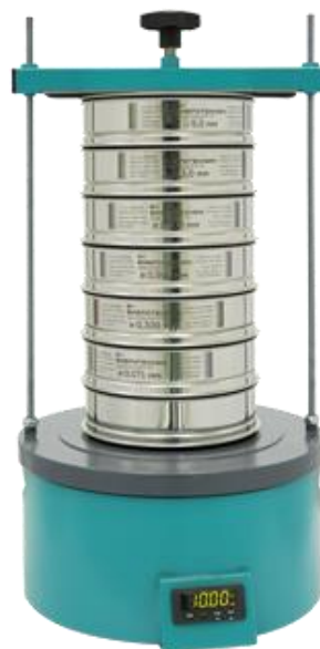
Рис. 2. Анализатор ситовой А 20