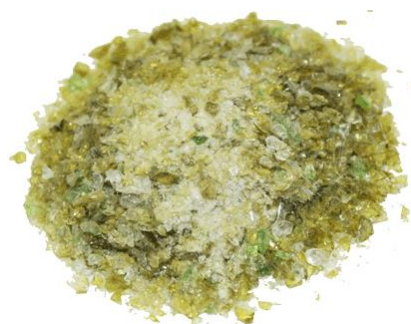
Рис.4. Продукт дробления