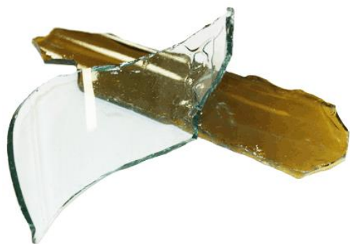
Рис.3. Материал до дробления