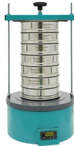
Рис 2. Анализатор А 20