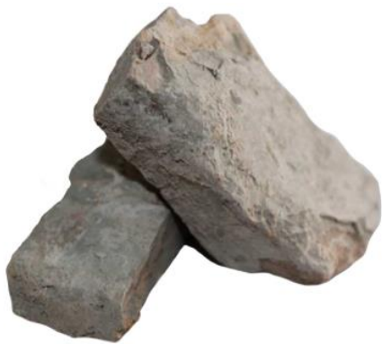
Рис.3. Материал до дробления