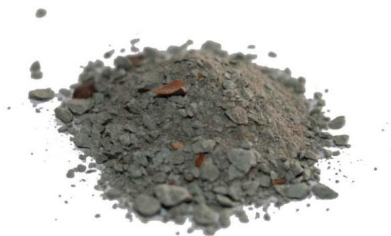
Рис.4. Продукт дробления