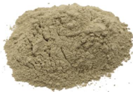
Рис. 4. Продукт измельчения.