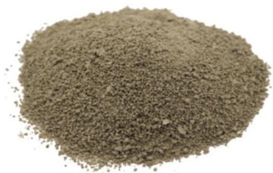
Рис. 3. Материал до измельчения.