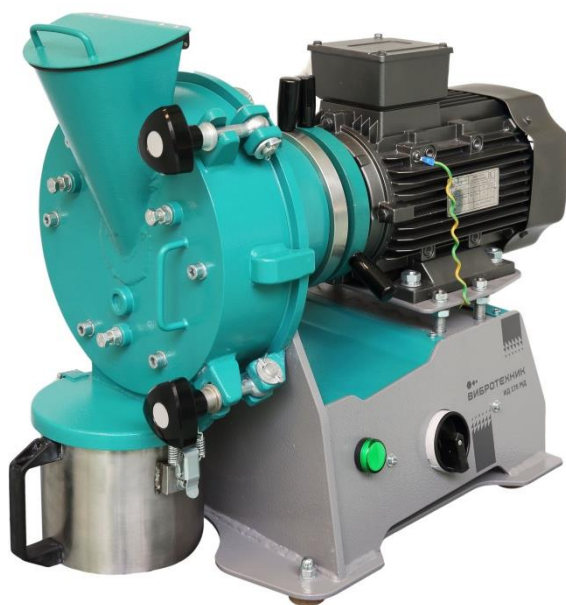
Рис. 1. Истиратель дисковый ИД 175М