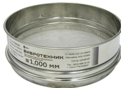
Рис. 2. Сито С20/50