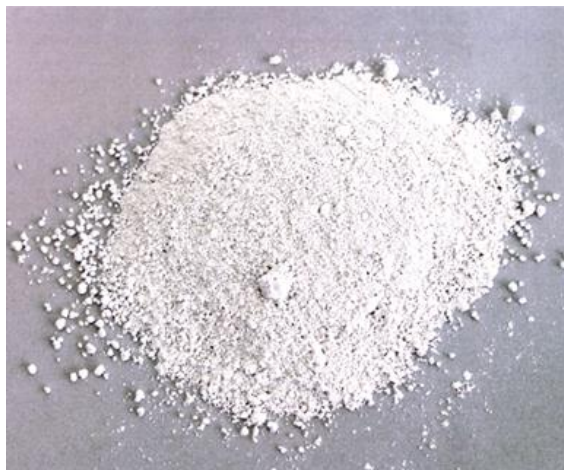
Рис.4. Продукт измельчения