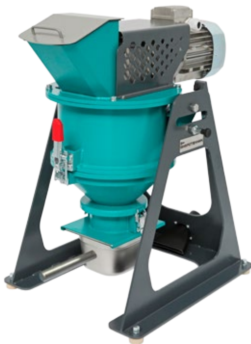
Рис 1. Истиратель почвы ИП 1