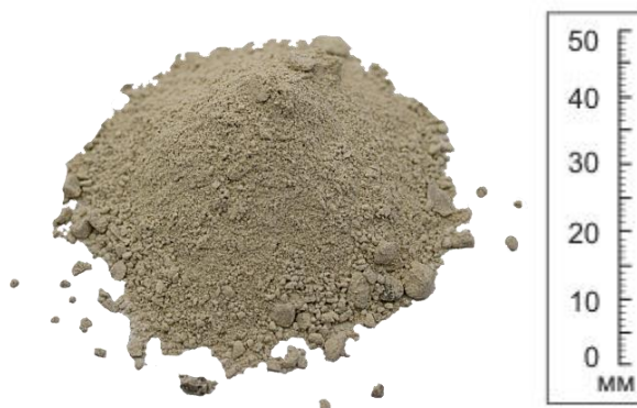
Рис. 4. Продукт дробления