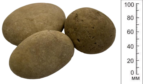
Рис. 3. Материал до дробления