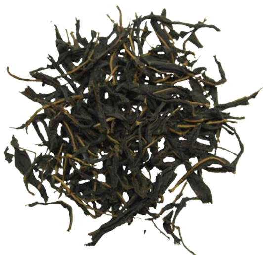
Рис. 2. Материал до измельчения