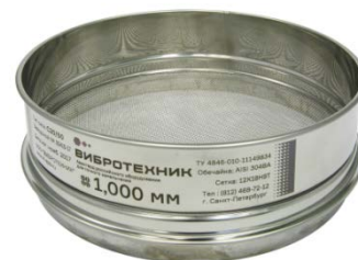
Рис. 3 Сито лабораторное С20/50