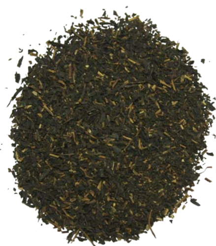
Рис. 3. Продукт измельчения