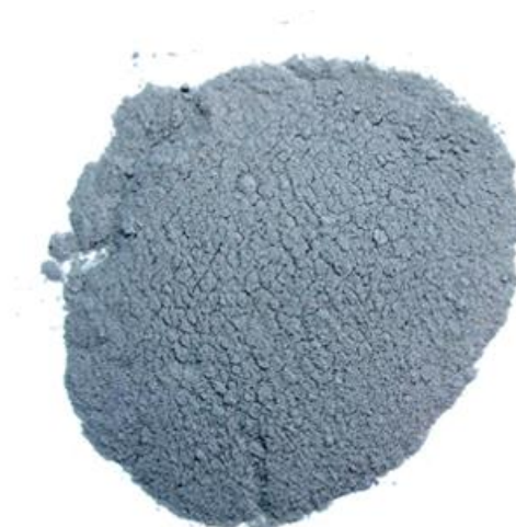
Рис. 4. Продукт измельчения