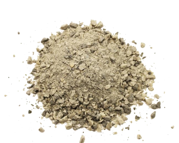
Рис. 4. Продукт дробления