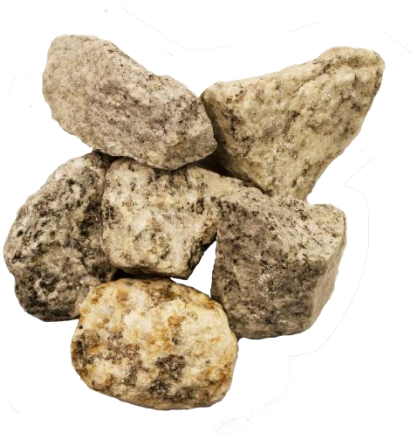
Рис. 3. Материал до дробления