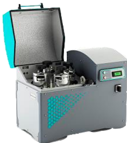
Рис. 1. Планетарная мельница МПП 1-4