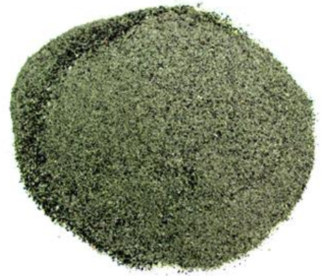
Рис. 4. Продукт измельчения