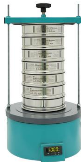
Рис. 2. Анализатор А 20