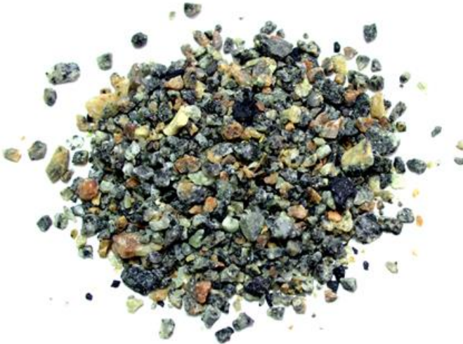
Рис. 3. Материал до измельчения