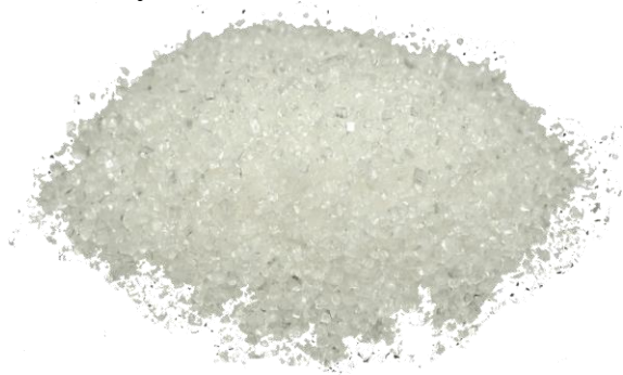
Рис.3. Материал до измельчения