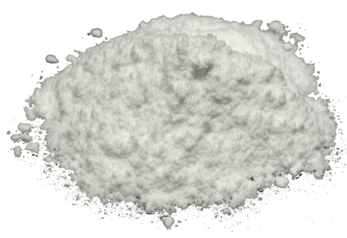
Рис.4. Продукт измельчения