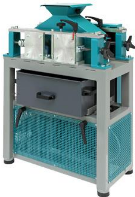
Рис 1. Дробилка валковая ДВГ 200x125