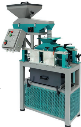
Дробилка валковая ДВГ 200x125 с питателем ПГ1