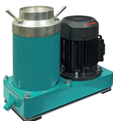
Дробилка конусная ВКМД 6