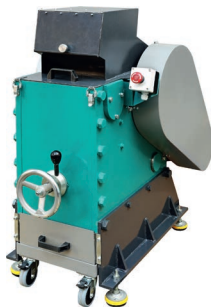
Щековая дробилка ЩД 15

Комплект разработан с учетом потребностей металлургических предприятий и обеспечивает весь комплекс работ по подготовке проб для физических испытаний и химического анализа в соответствии с ГОСТ 25207-85, 24991-81, 17260-80, 22310-84, 30642-99, 100096-76, 26999-86, 5954.9-91, 20515-75.