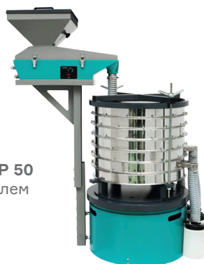
Грохот ГР 50 с Питателем ПГ 1