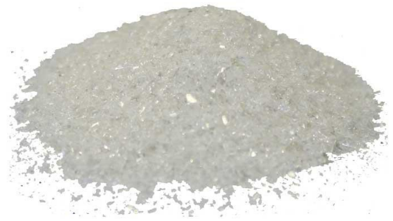
Рис.3. Материал до дробления