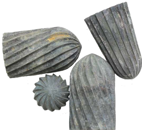
Рис. 3. Материал до дробления