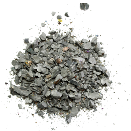
Рис. 4. Продукт дробления