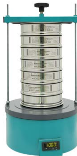
Рис. 2. Анализатор А 20