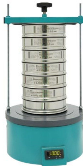
Рис. 2. Анализатор А 20