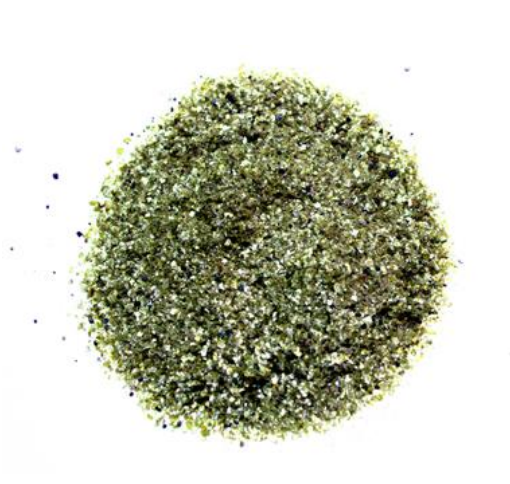
Рис.4. Материал до дробления