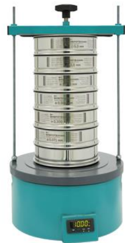
Рис. 3. Анализатор А 20