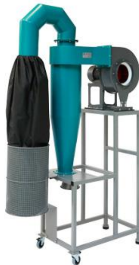
Рис.2. Блок пылеулавливания БПУ