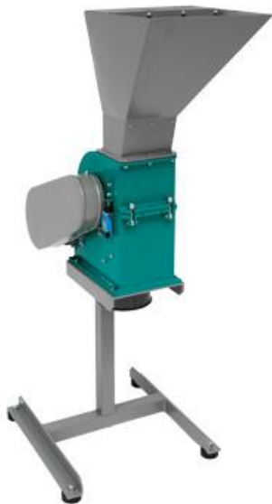
Рис. 1. Молотковая дробилка МД 2х2