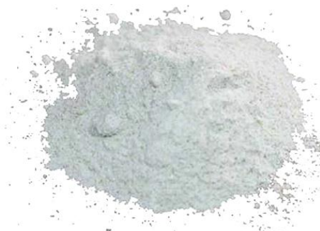
Рис.4. Готовый продукт