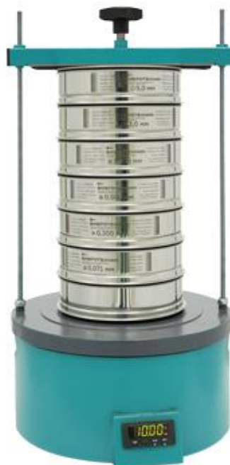
Рис 2. Анализатор А 20