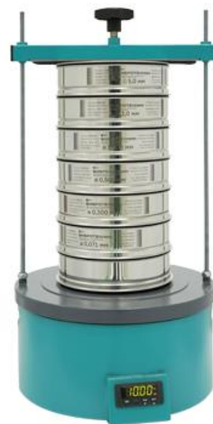
Рис 2. Анализатор А 20