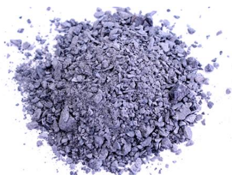
Рис. 4. Продукт дробления