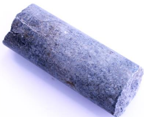
Рис. 3. Материал до дробления