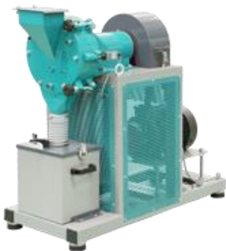
Рис 1. Истиратель дисковый ИД 250