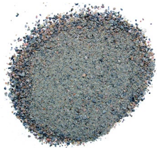
Рис. 4. Продукт измельчения