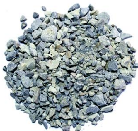
Рис. 4. Продукт дробления