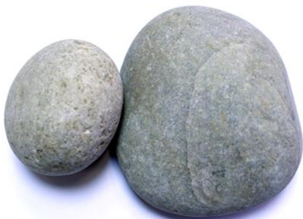
Рис. 3. Материал до дробления