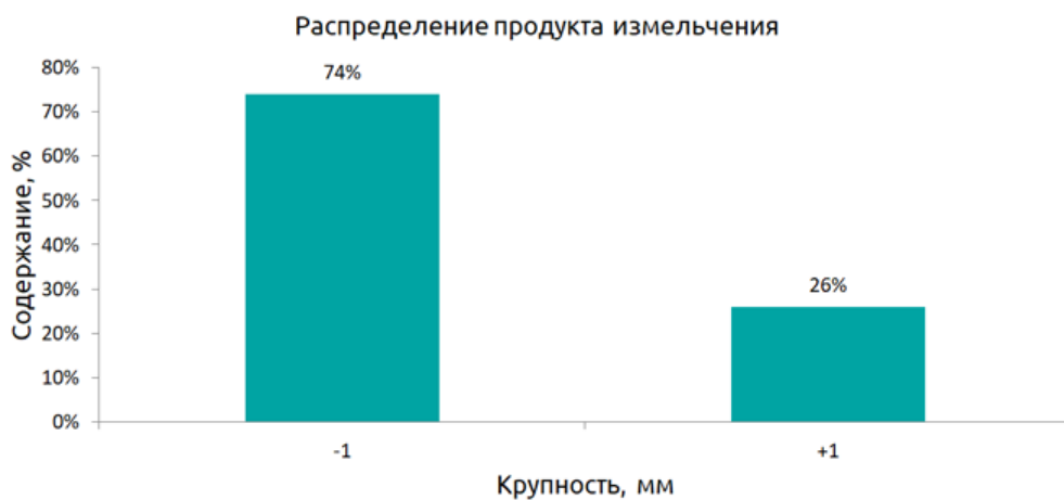
Рис. 5. Распределение продукта измельчения.