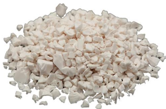
Рис. 3. Материал до измельчения.