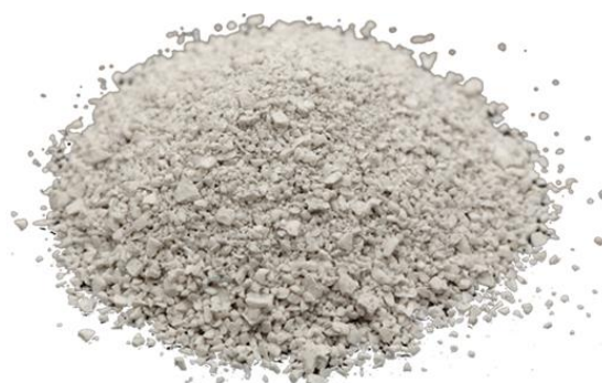
Рис. 4. Продукт измельчения.