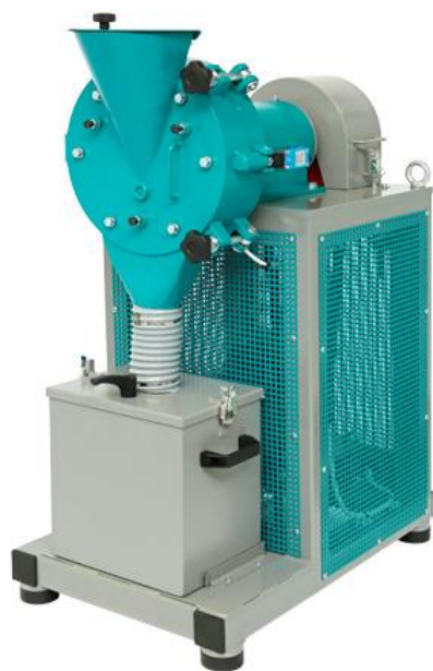
Рис. 1 Истиратель дисковый ИД 200.