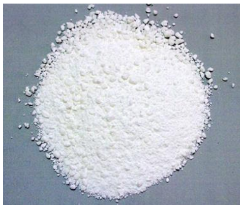
Рис.3. Материал до измельчения