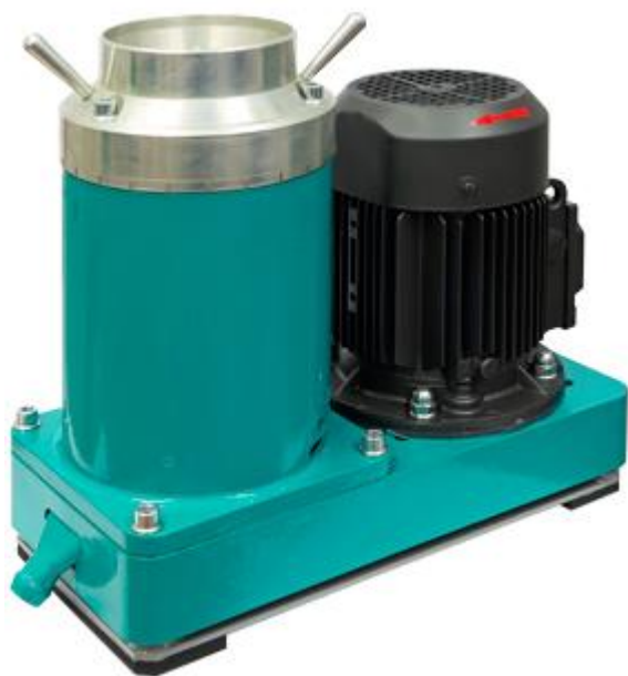
Рис 1. Вибрационная конусная мельница дробилка ВКМД 6