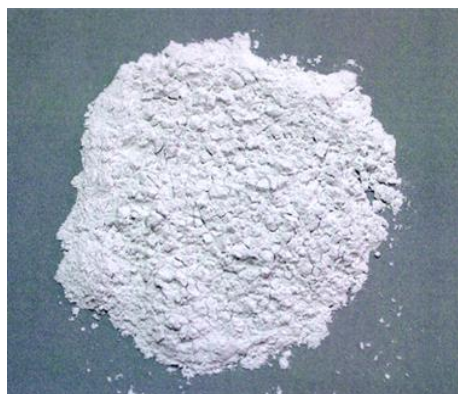
Рис.4. Продукт измельчения