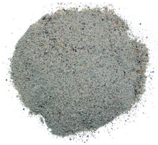
Рис. 4. Продукт измельчения