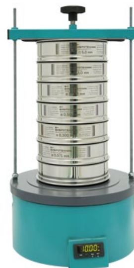
Рис. 2. Анализатор А 20