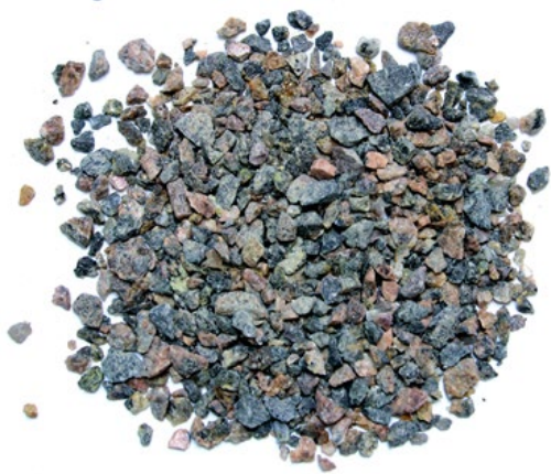
Рис. 3. Материал до измельчения