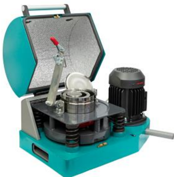
Рис. 1. Истиратель вибрационный ИВ 1