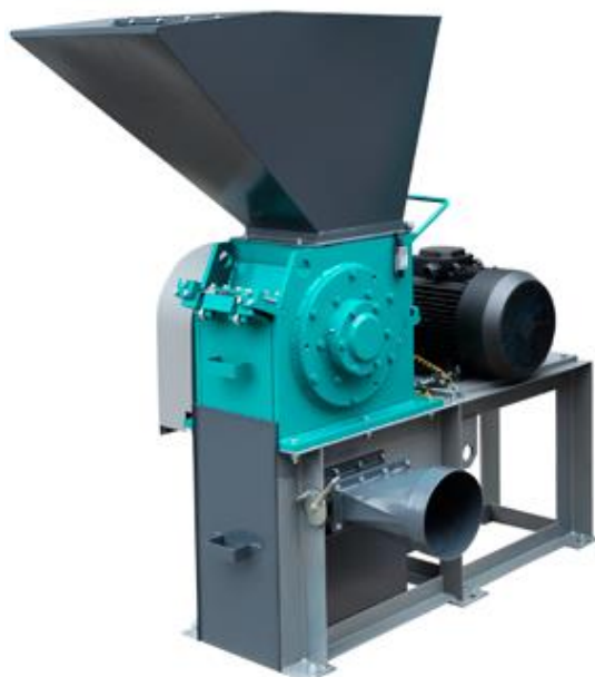
Рис. 1. Роторная ножевая мельница РМ 250