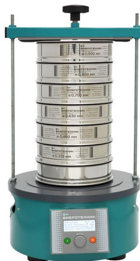
Рис. 2 Анализатор А 20 на базе Вибропривода ВПС