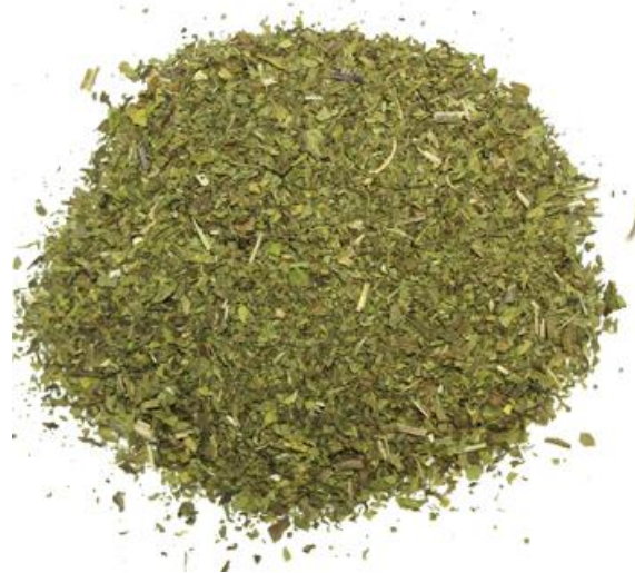
Рис. 4. Продукт измельчения