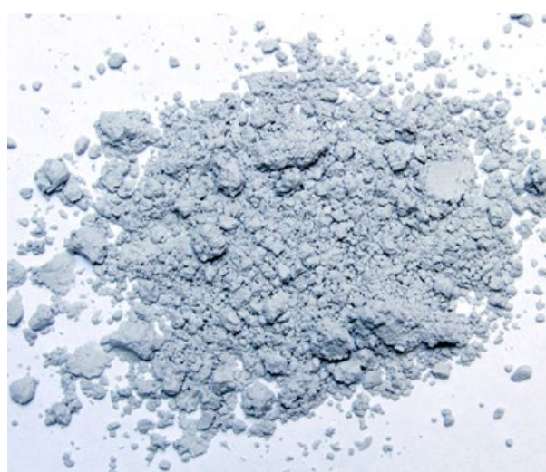
Рис. 5. Продукт измельчения