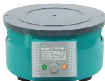
Рис. 2. Вибропривод ВПС