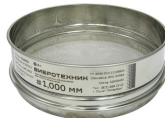
Рис. 3. Сито С20/50