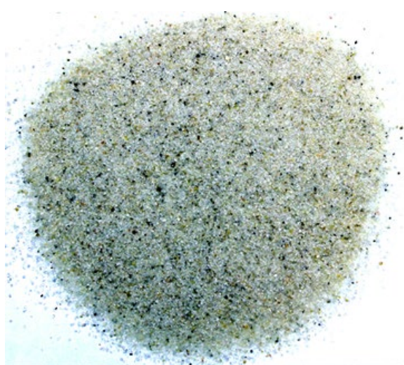
Рис. 4. Материал до измельчения