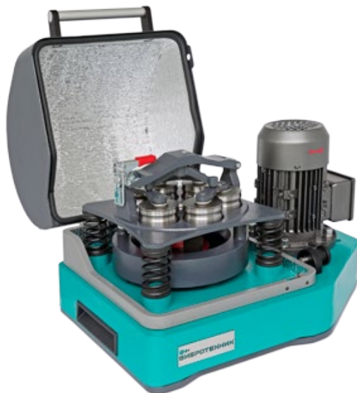
Рис. 1. Истиратель вибрационный ИВ 6