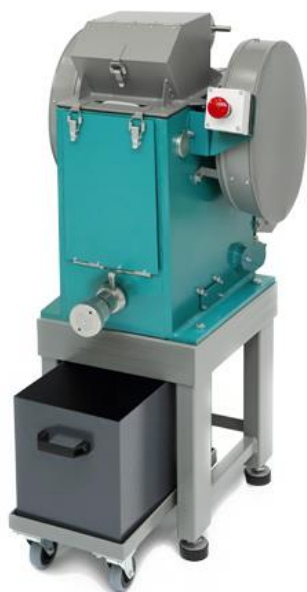
Рис. 1. Щековая дробилка ЩД 10М на опоре