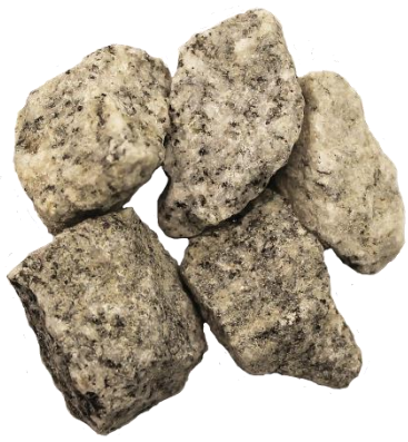
Рис. 3. Материал до дробления