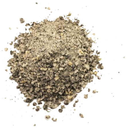
Рис. 4. Продукт дробления