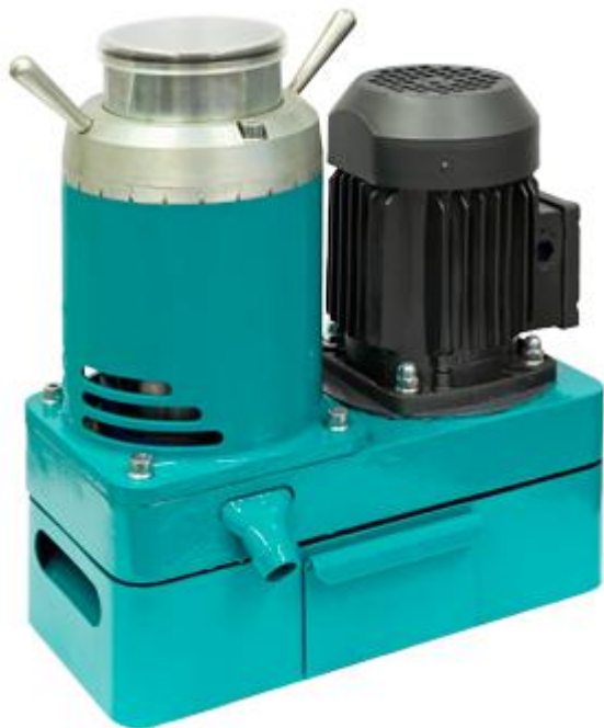
Рис. 1. Вибрационная конусная мельница-дробилка ВКМД 6