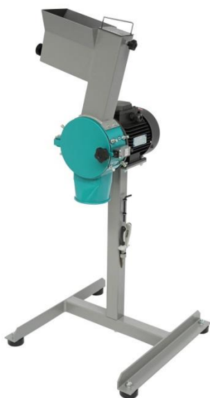
Рис. 1. Мельница ножевая РМ 120