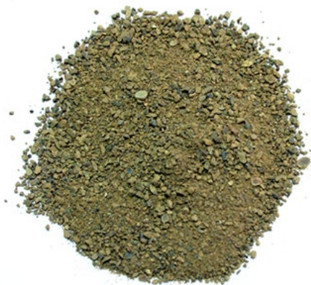
Рис.3. Материал до измельчения