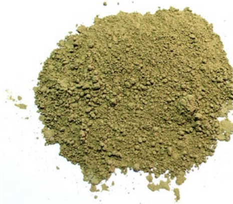
Рис.4. Продукт измельчения