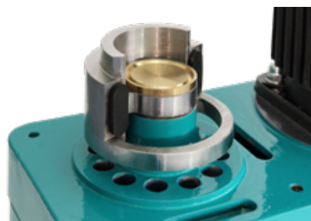
Ведущий дебаланс ВКМД 6