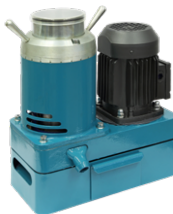
Мельница-дробилка ВКМД 6