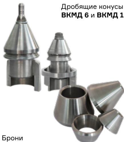
Дробящие конусы ВКМД 6 и ВКМД 10