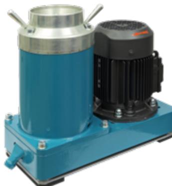
Мельница-дробилка ВКМД 10