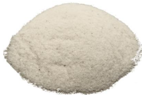
Рис. 4. Продукт измельчения