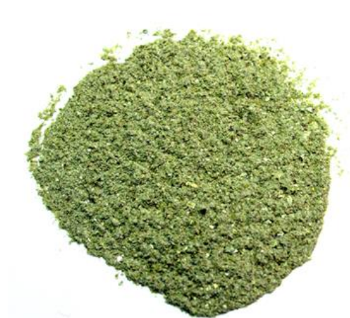
Рис.4. Продукт измельчения