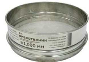
Рис. 3 Сито лабораторное С20/50