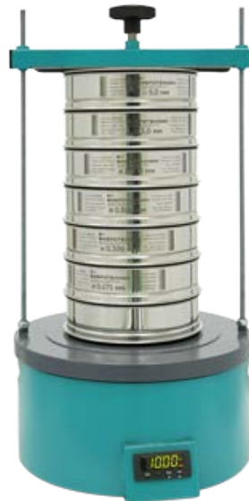
Рис. 2 Анализатор ситовой А 20