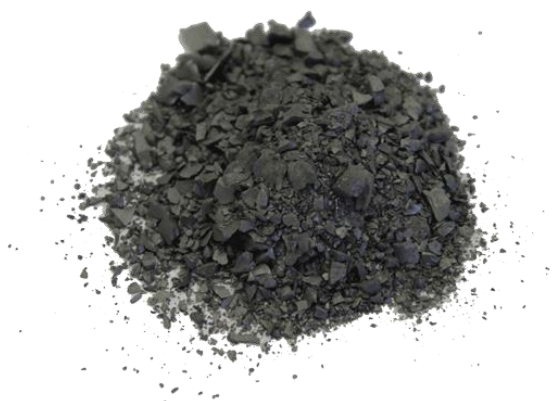
Рис.4. Продукт дробления