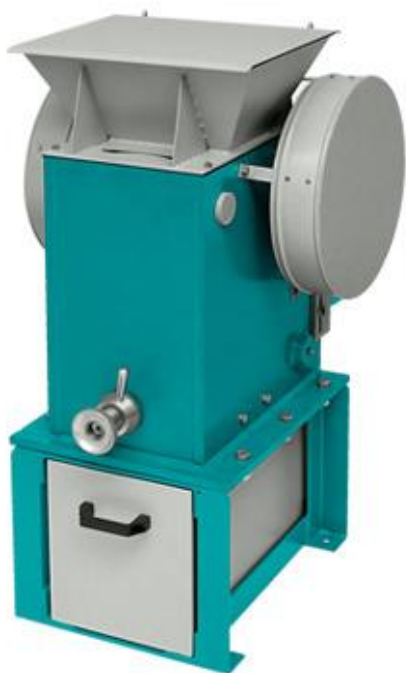
Рис 1. Щековая дробилка ЩД 10 на опоре