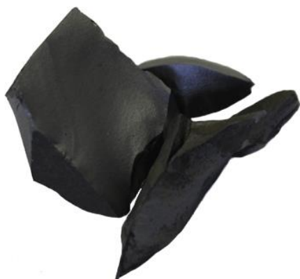
Рис.3. Материал до дробления