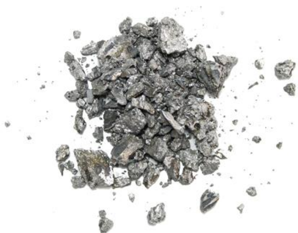
Рис. 3. Материал до дробления