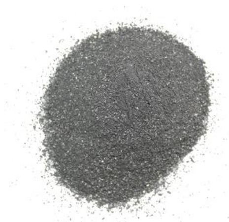
Рис. 4. Продукт дробления