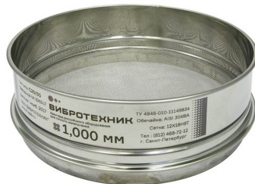
Рис. 2. Сито С20/50