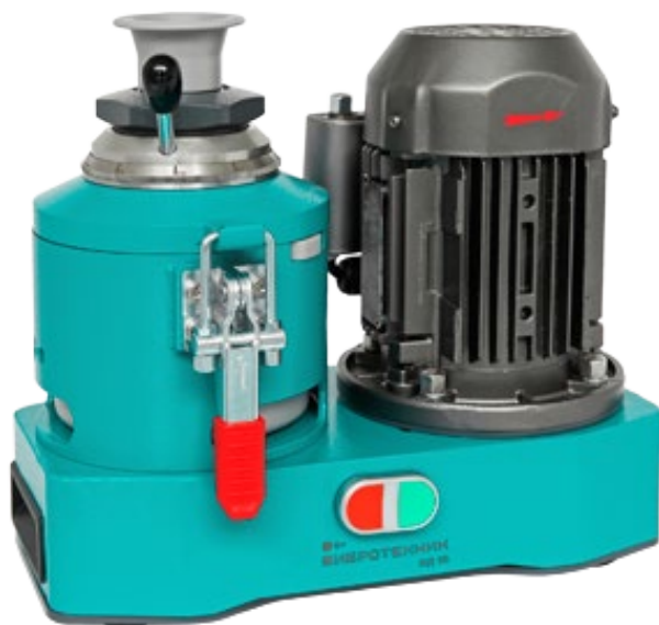
Рис. 1. Истиратель дисковый ИД 65