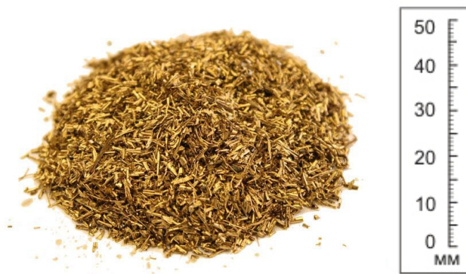
Рис.2. Материал до отсева