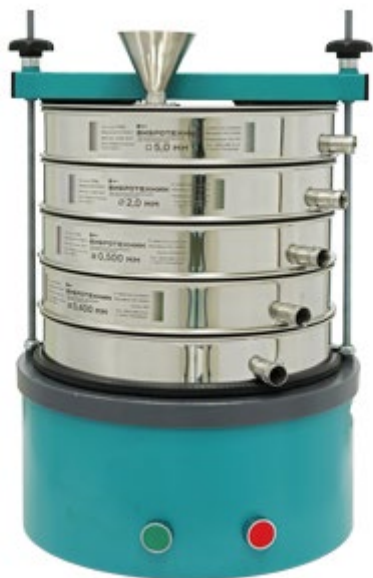
Рис. 1. Грохот ГР 30