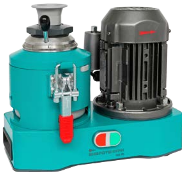
Рис. 1. Истиратель дисковый ИД 65