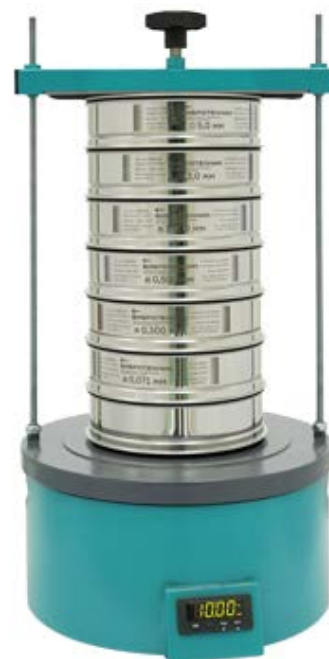
Рис. 2. Анализатор А 20