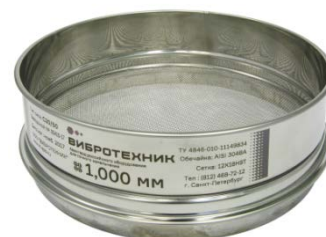
Рис. 3 Сито лабораторное С20/50