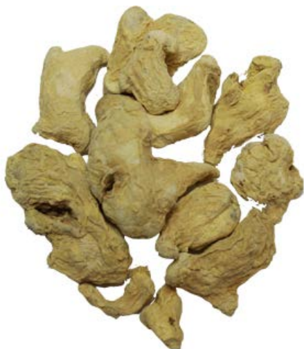
Рис. 2. Материал до измельчения