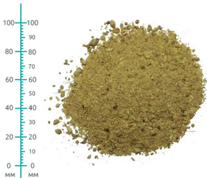
Рис. 3. Продукт измельчения