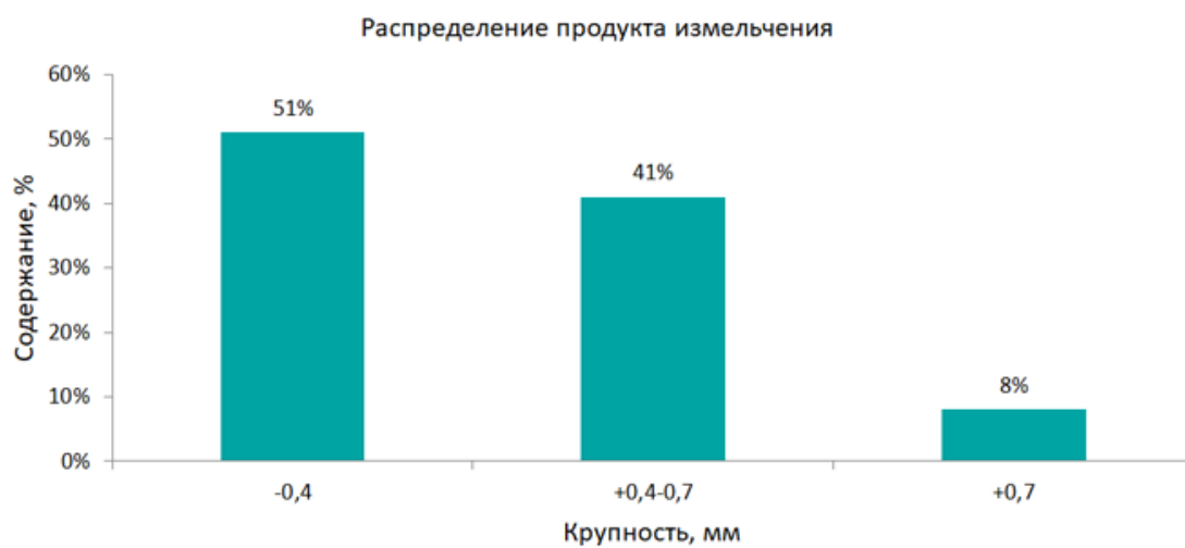
Рис. 5. Распределение продукта измельчения