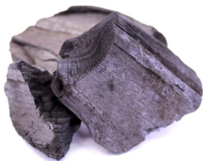
Рис.3. Материал до измельчения