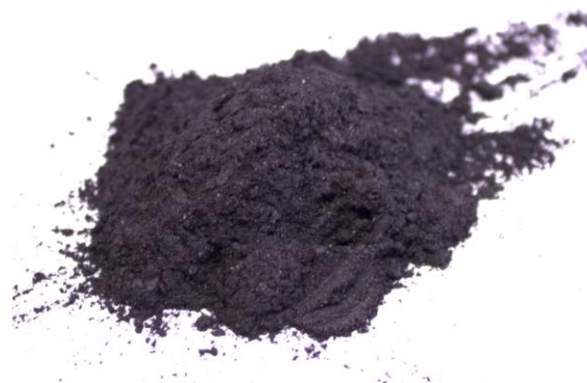
Рис.4. Продукт измельчения