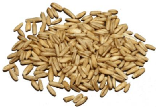
Рис. 3. Материал до измельчения.