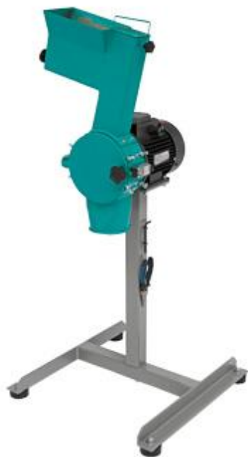
Рис. 1 Роторная ножевая мельница РМ 120.