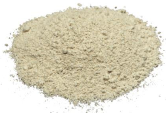
Рис. 4. Продукт измельчения.