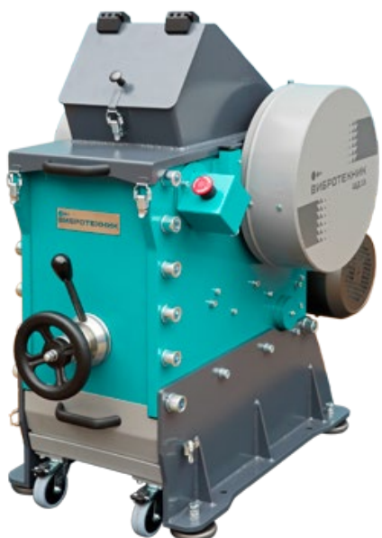
Рис 1. Щековая дробилка ЩД 15