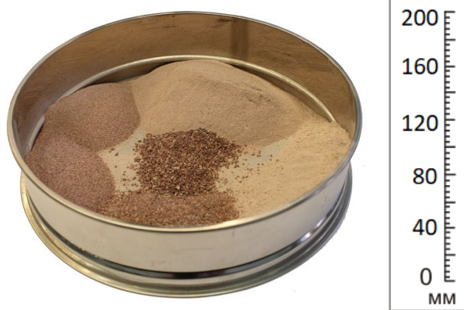
Рис. 4. Продукт дробления