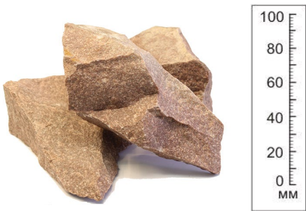
Рис. 3. Материал до дробления